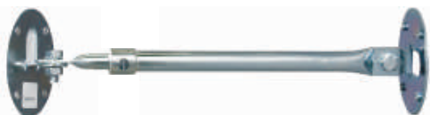
Fixation télescopique (30 - 50 cm)