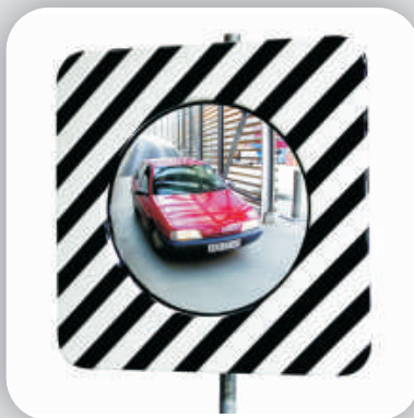
Disponible en format rond

Miroir routier réglementaire conforme à l'arrêté du 21/09/1981. Conditions d'utilisation: "Mise en place d'un régime de priorité, avec l'obligation d'arrêt STOP pour l'utilisateur, la distance entre la bande d'arrêt inférieurs 15 m, limitation de 50 km/h. Implantation à plus de 2,3 m de hauteur, trafic essentiellement local sur la route. "