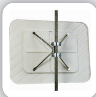
Fixation à 4-points avec rotule pour un meilleur réglage.