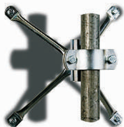
Fixation à 4-points avec rotule Poteau 50 - 85 mm