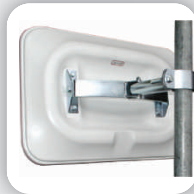
Fixation standard pour deux directions