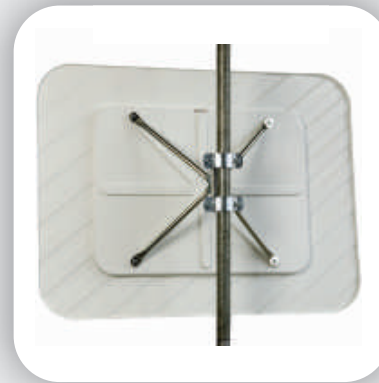
Fixation à 4-points avec rotule pour un meilleur réglage.