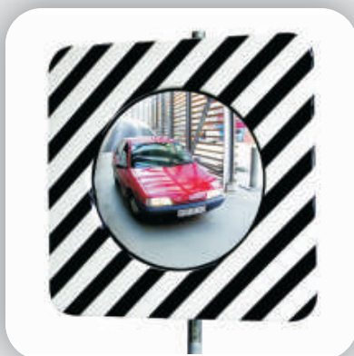
Disponible en format rond

L'avantage de notre miroir anti-buée/givre en matière plastique par rapport le miroir en inox est qu'il ne déforme pas après un choc d'une pierre. Il résiste plus longtemps avec une image sans déformation.