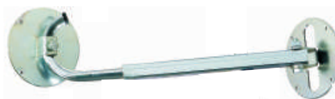
Fixation télescopique (30 - 50 cm)