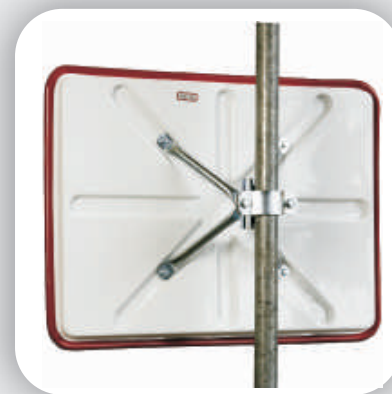
Fixation à 4-points avec rotule pour un meilleur réglage.