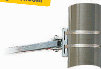
Adaptation pour la fixation pour poteaux rond