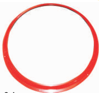
Miroir Subway Anneau en acier pour fixation sur mur