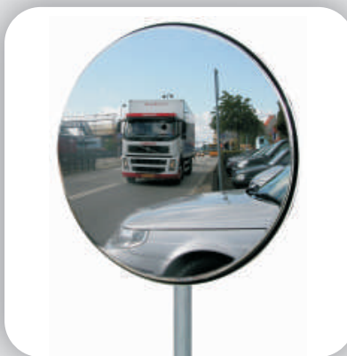
Disponible en format rond

Notre miroir Uni-Sig constitue une alternative économique. Ils sont utilisés partout où la visibilité ne permet pas une conduite sécuritaire: parkings, sorties de garages et zones industrielles.