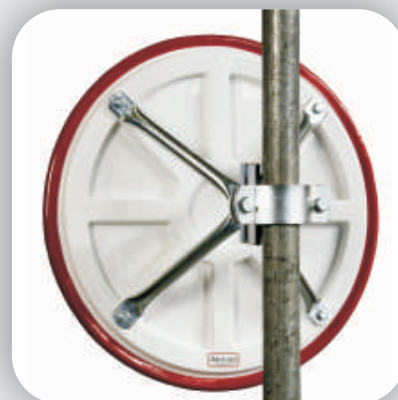
Fixation à 4-points avec rotule pour un meilleur réglage.