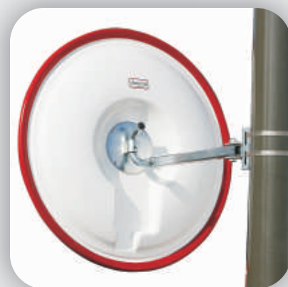
Fixation standard télescopique 30 - 50 cm (incl. adaptation)