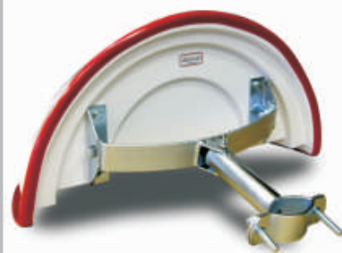
Fixation à 2 points