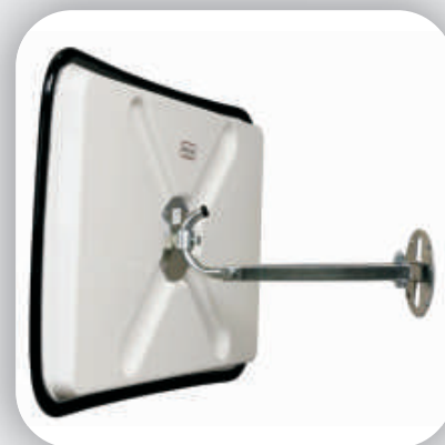
Fixation murale standard téléscopique (30 - 50 cm)